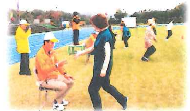
笑顔と歓声がいっぱい