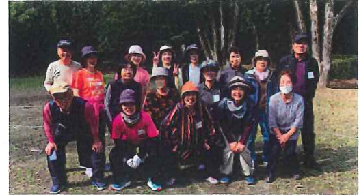
健康いきいき広場 in 高尾山