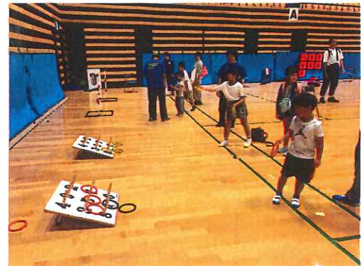
みんなのスポーツデー