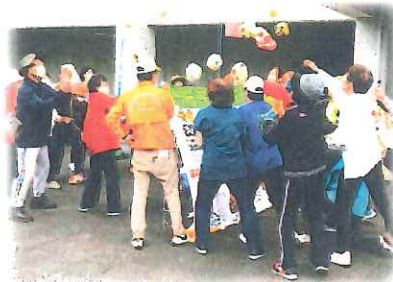
ゲーム大会はどの種目も盛り上がりました