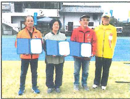
受賞された皆さんと会長の記念撮影

おおいに盛り上がり、笑顔と歓声が会場いっぱいに広がり、久々に会う県内のレク仲間との交流を深めました。その後、竹田市内武家屋敷通りに会場を移動して、たけた竹灯籠「竹楽」の竹並べ、点火ボランティア活動を地元の方々と一緒にするという貴重な体験をさせていただき、さらに竹灯籠で風情のある街並みの散策を楽しみ、感動と喜びでいっぱいの大会となりました。