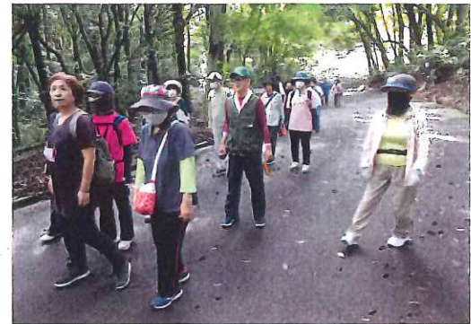
健康いきいき広場 in 高尾山