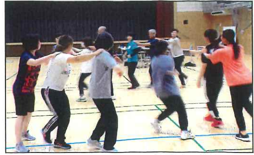
子どものレクリエーション指導者研修会