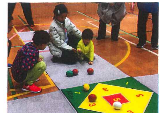
わさだユニバーサルスポーツフェスタ